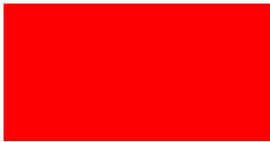
червоний SB005, 3 мм 1500x6100 мм 25 $/м 2